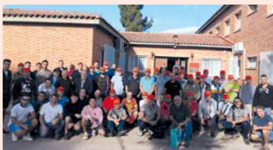
Visita tècnica varietats de cítrics per comarques Castelló