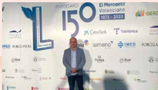
Acte commemoratiu 150 aniversari Levante-EMV