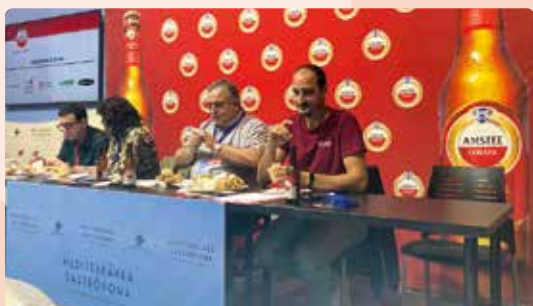
LA UNIÓ participa en la campanya #SomEsmorzadors d'Amstel