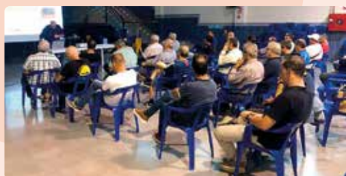
Xarrada informativa sobre el cultiu de la garrofa a Càlig