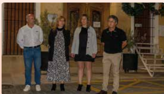
XVII Festa de LA UNIÓ a Quatretonda