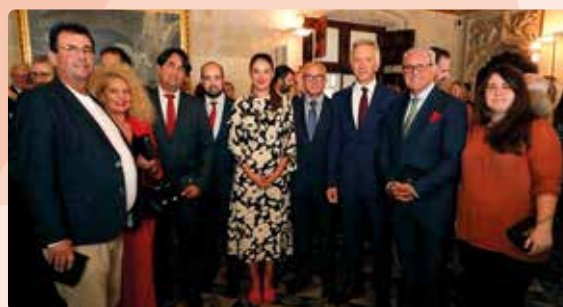
Distinció al mèrit empresarial i social de la Generalitat del 9 d'octubre