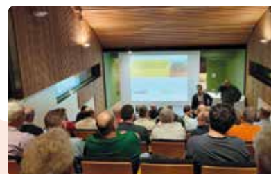
Xarrada informativa sobre el cultiu de la garrofa a Benissa