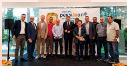
Presentació Campaña Caqui Ribera del Xúquer