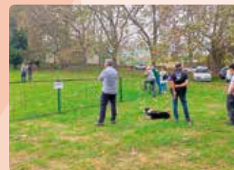
Curs pastoreig gossos ramat a Albocàsser