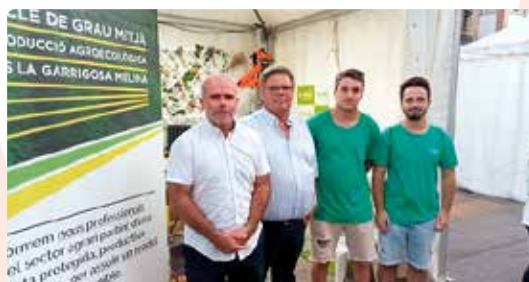
LA UNIÓ a la FIMEL de Meliana