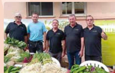
LA UNIÓ, a la Fira de Vallada