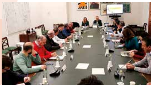
Reunió sobre la PEPAC a Conselleria d'Agricultura