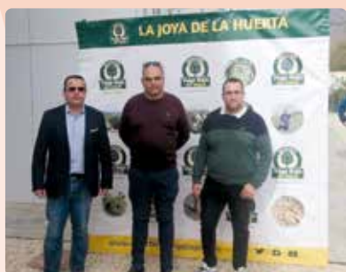
Acto de inicio de la campaña de la Alcachofa de la Vega Baja