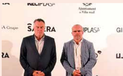
XIX edició premis Ràdio Castelló-SER