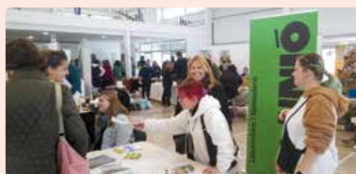
Feria de la Trufa de El Toro