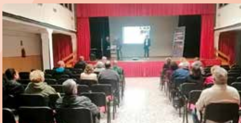
Charla informativa sobre el cultivo del algarrobo en San Miguel de Salinas