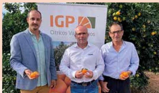
LA UNIÓ, en l'acte del I Tall dels Cítrics Valencians