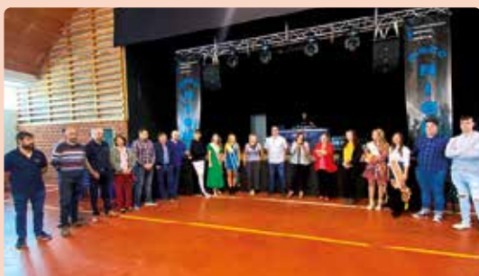
LA UNIÓ, a la Fira d'Albocàsser