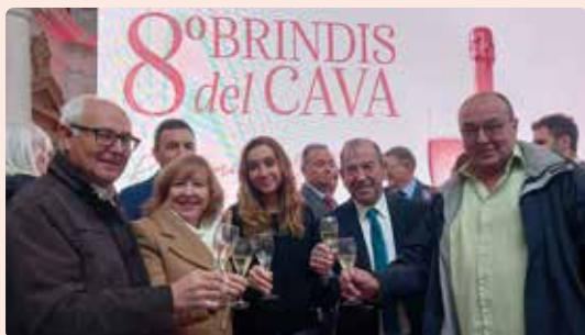
8º Brindis del Cava en Requena