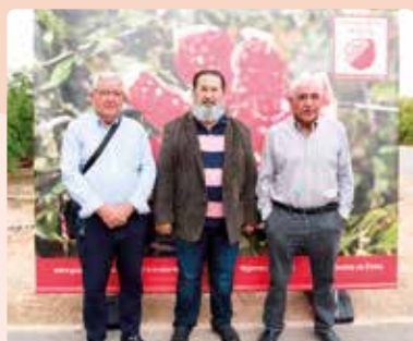
Acto del I Corte de la Granada Mollar d'Elx