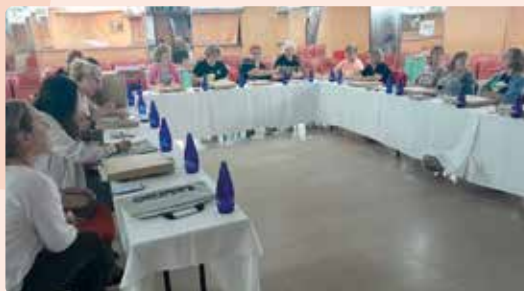
Trobada de Dones de LA UNIÓ a Calp