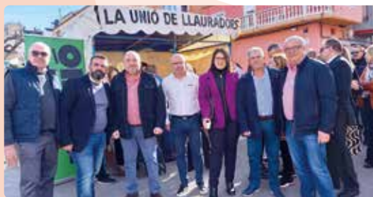
LA UNIÓ, a la fira de Cabanes