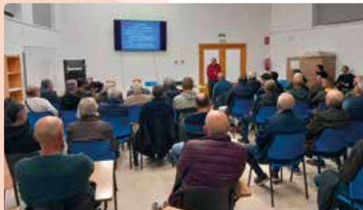
Xarrada informativa sobre el cultiu de l'alvocat a Oliva