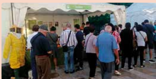
LA UNIÓ, a la Fireta del Camp d'Elx