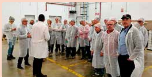
Acompañamiento de la organización italiana Coldiretti por diversos lugares de nuestro territorio