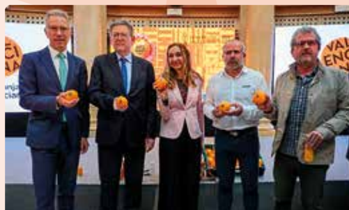
Presentació campanya marca Taronja Valenciana, Tria Sentiment