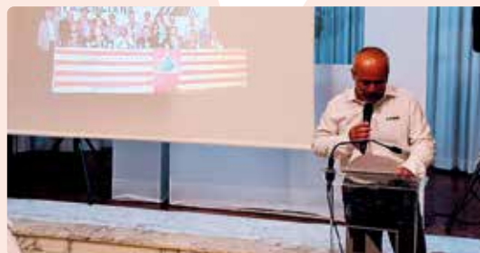
Amb la Intersindical Valenciana en l'acte del seu 20 aniversari