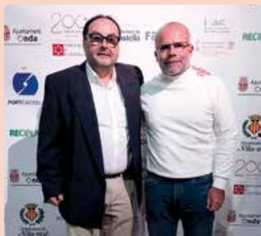
Acte del X Aniversari del digital Castellón Informació