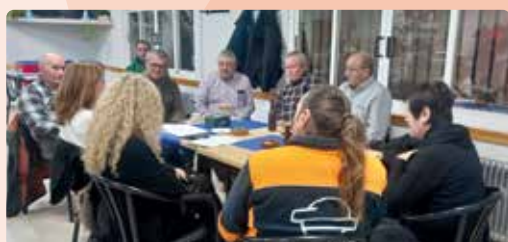
Charlas informativas sobre seguros agrarios en Utiel-Requena