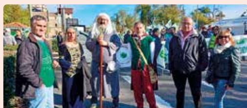
Participación de LA UNIÓ en la manifestación de Toledo de la Unión de Castilla-La Mancha