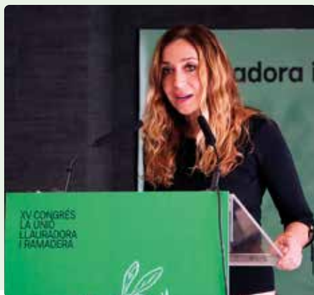
Isaura Navarro, consellera d'Agricultura