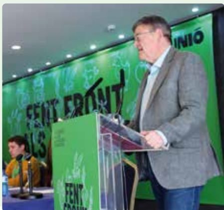
Ximo Puig, president de la Generalitat