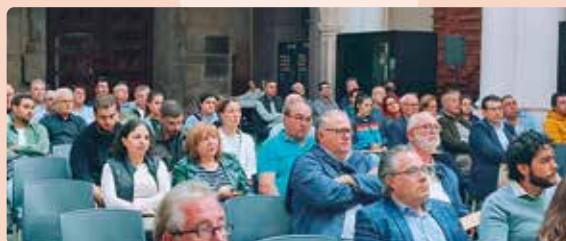
Foros del Cava de Utiel-Requena