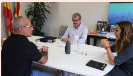
Primera reunió de LA UNIÓ amb la consellera d'Agricultura, Isaura Navarro